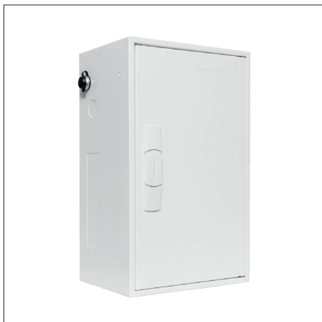
TAP-Verdrahtungsbox 230 V

Verdrahtungsbox zum sicheren und fachmännischen Anschluss von blueChip und blueSmart Aufbuchlesern.