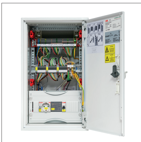
TAP-Verdrahtungsbox 230 V