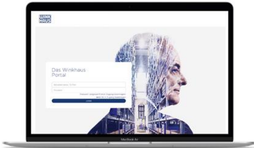
Bild 1: Das neue Winkhaus Portal bietet seinen Partnern und Kunden wertvolle Unterstützung im Berufsalltag.

Jederzeit bereit für die Anliegen der Kunden: Ab sofort können Winkhaus Partner viele zusätzliche Services nutzen. Denn im März 2022 geht eine neue Online-Plattform an den Start, die wertvolle Dienste leistet.