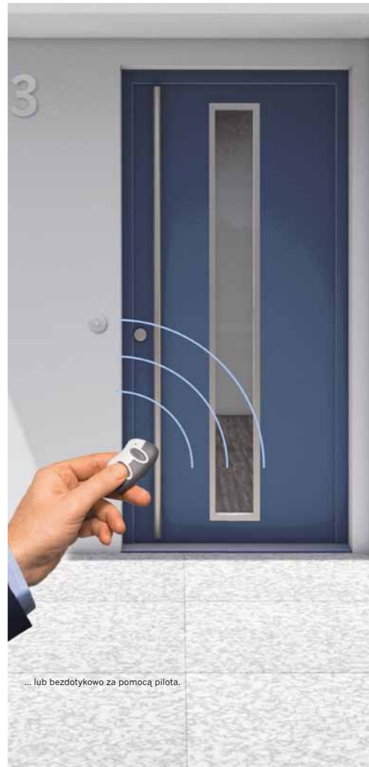
... lub bezdotykowo za pomocą pilota.