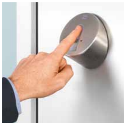
Odryglowanie drzwi – czytnikiem linii papilarnych...

Zamek AV3 występuje nie tylko w wersji mechanicznej, a także w wariacie blueMatic EAV3 wyposażonym w napęd elektryczny. Wariant elektryczny zamka to komfortowe rozwiązanie, umożliwiające automatyczne zaryglowanie i zdalne odryglowanie drzwi przy pomocy pilota, transpondera, telefonu komórkowego, czytnika linii papilarnych itp. Od wewnątrz drzwi otwieramy tradycyjnie klamką.