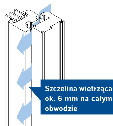
Wietrzenie szczelinowe z powodzeniem zastępuje funkcję uchyłu

Innowacyjność okucia polega na zastąpieniu funkcji uchyłu nowym rozwiązaniem, które nie tylko pozwala zachować dotychczasową funkcjonalność okna, ale nawet istotnie ją zwiększa! Okucie activPilot Comfort PADS łączy funkcję rozwierną z funkcją równoległego odstawienia skrzydła od ramy, umożliwiającą wietrzenie poprzez ok. 6-milimetrową szczelinę na całym obwodzie okna. Takie rozwiązanie pozwala na efektywną i przede wszystkim bezpieczną wymianę powietrza, ponieważ okna w pozycji odstawienia są zaryglowane. Nowy sposób wietrzenia zapewnia zdrowy klimat w pomieszczeniach i w porównaniu do funkcji uchyłu znacznie zmniejsza straty energii. Eliminuje także problem przeciągów – dzięki specjalnej konstrukcji zaczepów odstawione skrzydło jest unieruchomione i nie dochodzi do jego zatrzaskiwania. Funkcja odstawienia skrzydła od ramy z nadatkiem zastępuje więc uchył, który powoduje gros problemów z oknami o nietypowych kształtach.