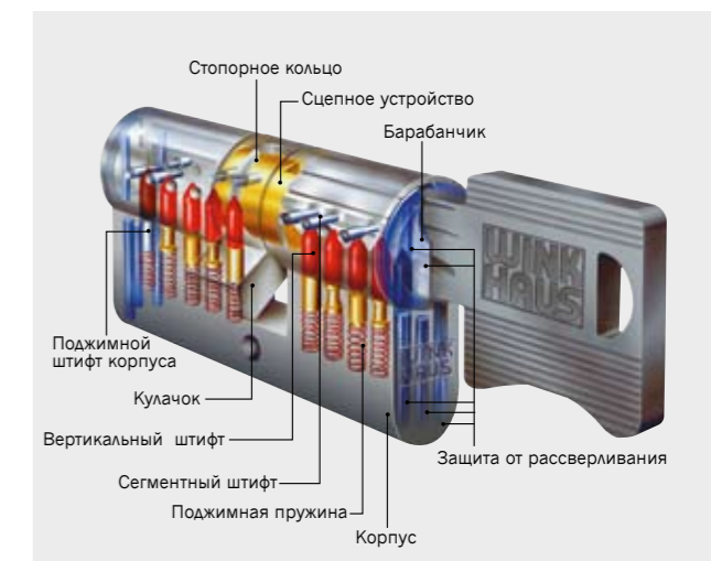
Так сконструирован цилиндр Winkhaus VS.