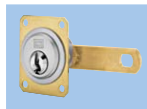
Цилиндр с ригелем