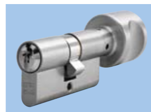
Цилиндр с воротком